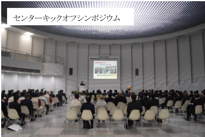
センターキックオフシンポジウム