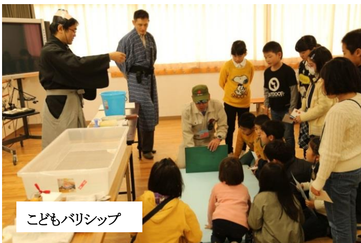
こどもバリシップ