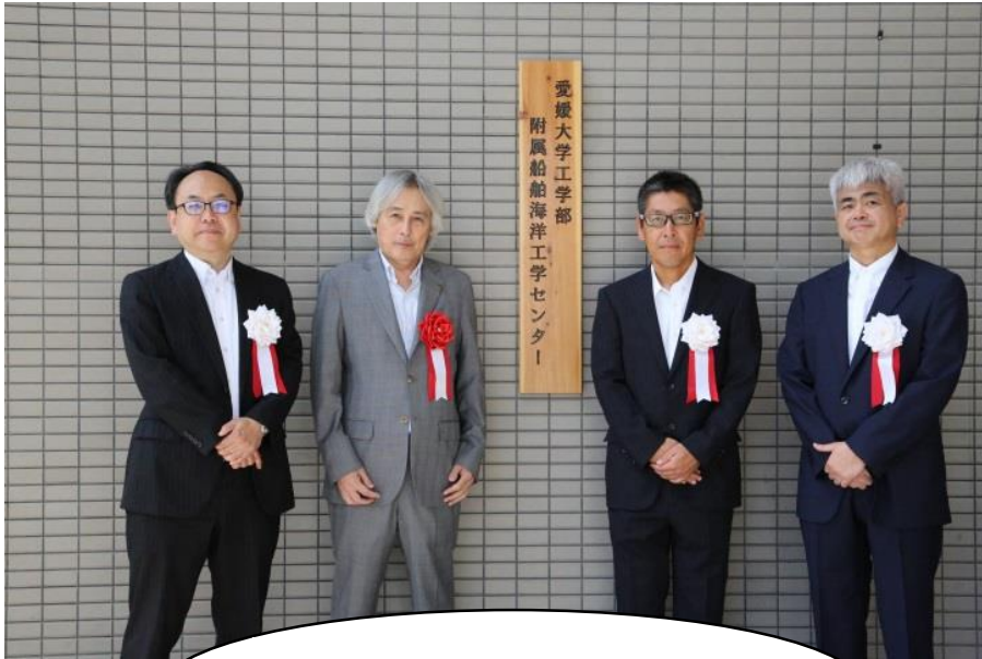
センター看板除幕式